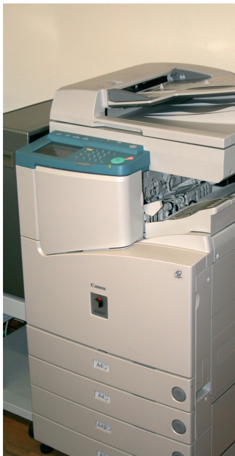
e-Maintenance, la solution pour la gestion complète de parcs de photocopieurs.